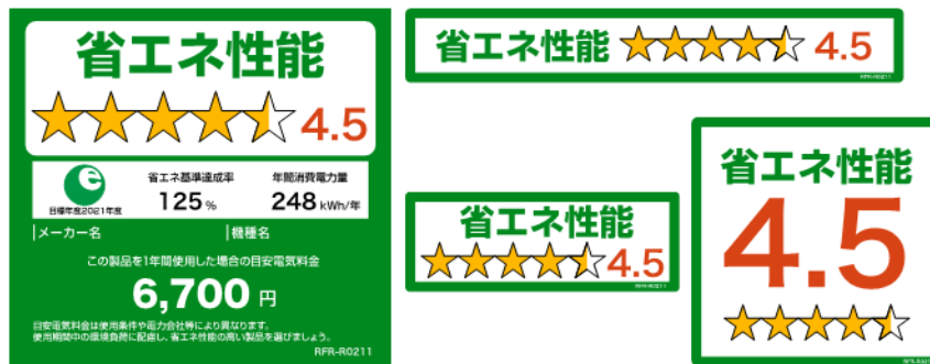
(冷蔵庫のイメージ)