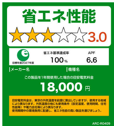
(家庭用エアコンディショナーのイメージ)