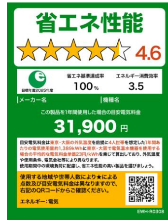
(電気温水機器のイメージ)

※家庭用エアコンディショナーの統一省エネラベルについては、2022年10月から図5に変更。温水機器以外は、製品のサイズやネット取引等の限られたスペースで使用する場合は右側のミニラベルを活用すること。