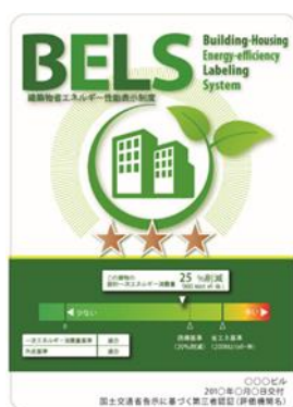
〔図1〕 ガイドラインに基づく第三者認証の例

消費者への認知度向上を図るため、ZEHビルダー/プランナーをはじめとするZEHに関係する事業者は、インターネットやテレビ、雑誌等の広報媒体を介して、ZEHマーク〔図2〕とともに光熱費低減やヒートショック関連の健康リスクの低減といったZEHのメリットを積極的に発信すること。