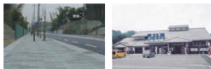
写真-1 歩道 写真-2 道の駅

一方、局部照明については、「旧設置基準」において設置対象箇所として扱われている交差点や橋梁等に加えて、新たに歩道や道の駅が設置検討場所として追加されました。