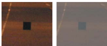
図-2 障害物の見え方のイメージ (左:グレア小、右:グレア大)

これが今回の改訂により、確保すべき性能が明確化されたため、灯具配光の種類等によらずグレア抑制に関する定量的な所期の性能が得られることとなりました。